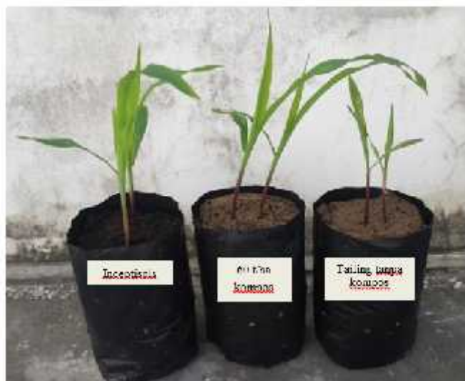
Gambar 1. Pertumbuhan tanaman jagung di tailing tanpa bahan organik (kanan) terhambat dibandingkan dengan tanaman yang ditanam dengan penambahan bahan organik 60 t/ha (tengah) dan di tanah Inceptisols (kiri).

Secara visual, tanaman yang ditanam di tailing tumbuh terhambat dibandingkan jagung yang ditanam di tanah Inceptisol terutama dari warna daun (Gambar 1). Namun tinggi tanaman jagung yang diberi 60 kg/ha kompos menyamai tanaman di tanah biasa.