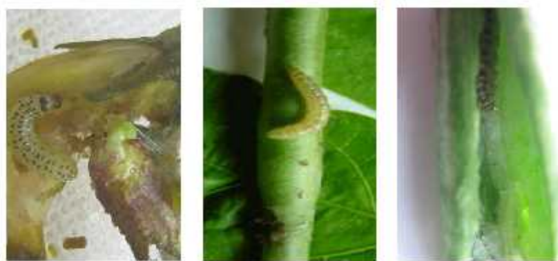
Gambar 1. Larva Maruca testulalis perusak bunga dan polong kacang panjang

bawah guguran daun. Pupa terbentuk di dalam sel pupa ber dinding ganda di bawah daun-daun yang telah gugur. Dinding luar sel pupa mengandung benang sutera yang dianyam bersama-sama dengan tanah dan sisa-sisa tanaman. Dinding bagian dalam merupakan anyaman longgar benang keputih-putihan, dan memiliki lubang dibagian depan ( anterior ). Pembentukan pupa juga dapat terjadi pada kokon di dalam polong, atau lebih jarang didalam tanah.